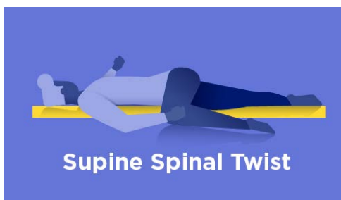
Supine Spinal Twist